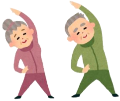
一般介護予防事業