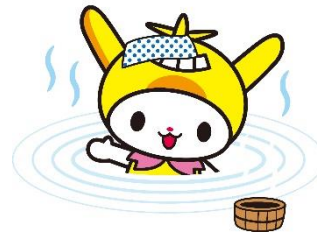
いきいき高齢者入浴事業