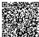
高齢受給者証の交付