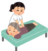
はり・きゅう・マッサージ・指圧施術割引券