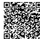
自分らしい老いじたく