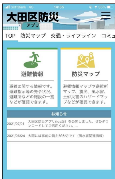
▲大田区防災アプリトップページ