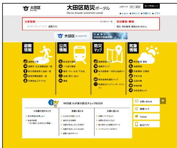
▲大田区防災ポータルサイトトップページ