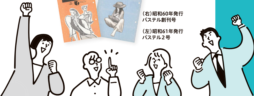
(左)昭和61年発行 パステル2号