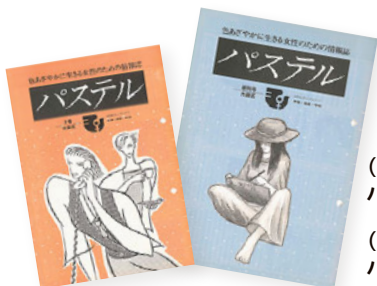
(右)昭和60年発行 パステル創刊号

時代の流れとともに、「婦人会館」の名称は、平成4年に「おおた女性センター」へ、さらに平成12年に「男女平等推進センター」「エセナおおた」へと変わりました。「エセナおおた」という愛称とシンボルマークは、一般公募によって決定しました。「エセナ」は、スペイン語で「ステージ、場、場面」という意味があり、「エセナおお