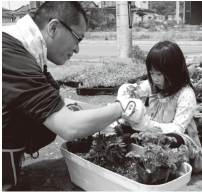
大田区と東松島市地域住民による「お花いっぱい計画」で、地域コミュニティの再生と復興まちづくり。

支援体験者だとすれば、被災者になった場合、避難所におそらく一人は支援体験者がいて、それを生かすことができるはずですが、また、避難時に大事なものはコミュニケーションですが、これも普段から心がけていないとできません。そして、大きな避難所や仮設住宅には食料が配給されますが、そこからさらに配る仕組みがない。小さい避難所や在宅で被災している人には食料がいかない結果、コミュニケーションがズタズタになる。そんな地域再生のためには何をすればいいのか。東松島でやったことが将来大田区で起こるかもしれないこととつながっていく。そんな気がしています」 また、現地支援では男女の協力体制は老若男女の混合で、当然寝る場所はもうまくいっています。ボランティア