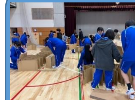
体験型訓練 (高校体育館)