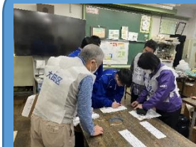
本部員による 本部運営訓練