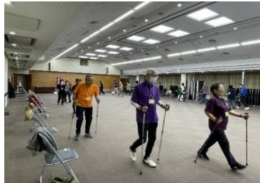
室内講習(ボールの持ち方や姿勢確認)