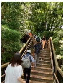
外回り(景色や会話を楽しみながら散策)