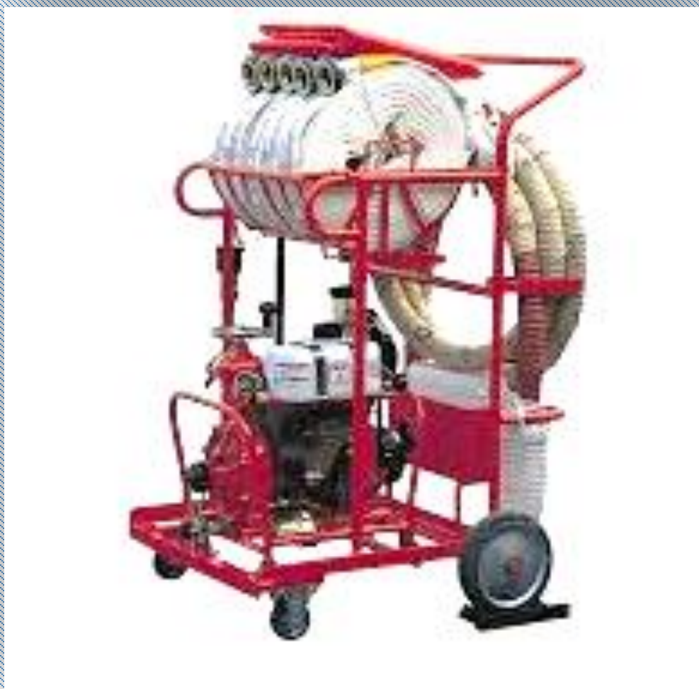
D級ポンプ一式（台車付き）