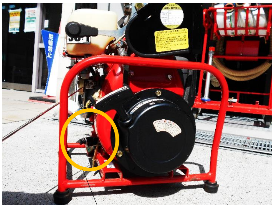
燃料ドレン レバー

注意 燃料ドレンレバーを引くと燃料が全部流れ落ちます。 ※ 必ず燃料コックが「閉」になっていることを確認してください。