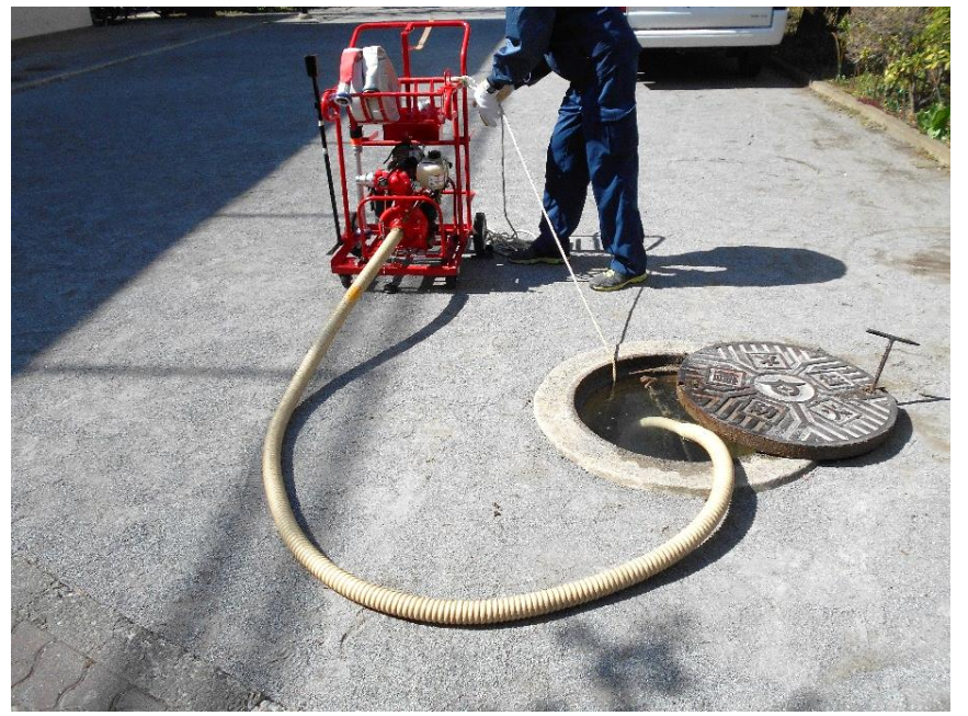
防火水槽に吸管を挿入した吸水完了状態