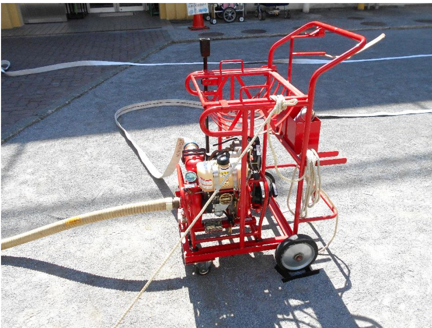
吸管とホースの取付け状態