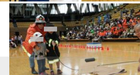
ぼくもわたしも消防士