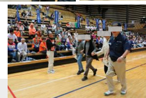
避難所はつらいよ