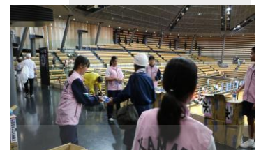
水・クラッカー配布