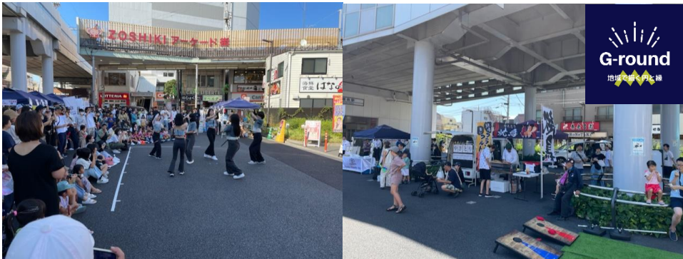
育成塾出身者による水門通り商店街振興組合のイベントマルシェ G-round「地域で描く円と縁」 本事業は令和5年度東京商店街グランプリを受賞しました。 P.32 をあわせてご覧ください。

「次世代リーダー育成塾」で実践を経験した若手商店街会員は、イベントを収益事業化し継続的に実施することで、地域を盛り上げる賑わいの創出に貢献しています。また、所属している商店街のイベント担当者を担うなどして活躍の場を広げています。