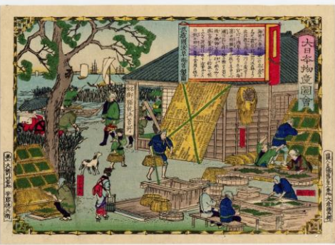
「大日本物産図会 武蔵国浅草海苔製図」 (明治十年 歌川広重 (三代))