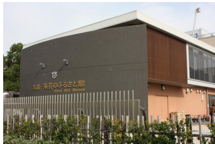
大森 海苔のふるさと館

開館から8年、来場者は70万人を突破。地域の人にはもちろん、遠方からの来訪者にとっても楽しめる、憩いと学びの空間となっています。