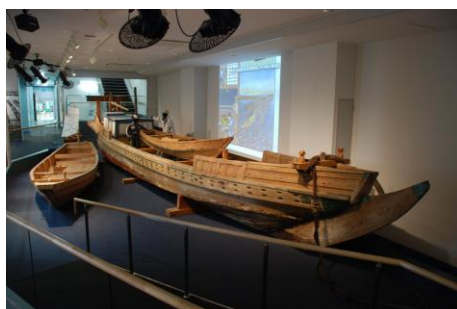
1 F 展示室「海苔船」