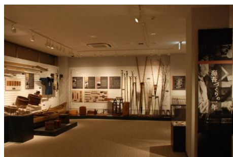
2F展示室「海苔づくりの一年」