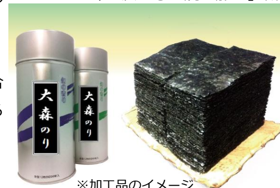
※加工品のイメージ