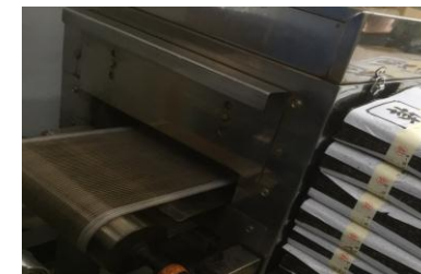
味を決める「焼き加工」機器