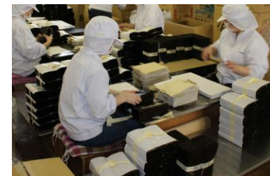
火入れ前の「海苔のぼし」