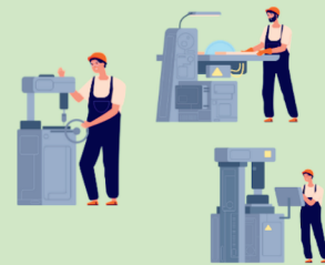
ハブ企業・ものづくり事業者

企画設計から相談 できます。試作・製造 までを一気通貫で頼め る企業をさがせます。