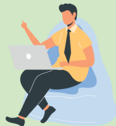
ものづくり相談者

ものづくり相談者ともものづくり事業者が 共に挑戦・成長していくプラットフォームです