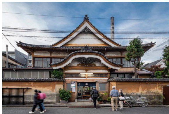
宮造り建築の「 明神湯 」 焼き立てのピザが楽しめる 「 蒲田福の湯 」