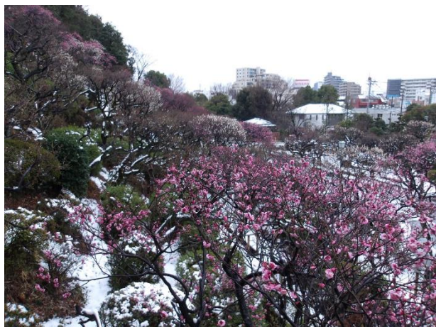
雪景色の池上梅園 (R6.2.6撮影)

2月から3月にかけて池上梅園では30種余りの梅の花が咲き揃います。特に丘陵斜面に咲く紅梅は大変華やかです。また、期間限定でライトアップを行います。池上周辺の散策と併せてご来園ください。