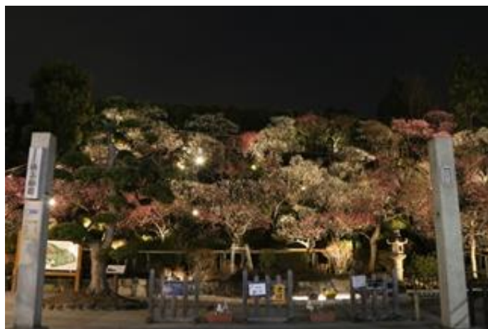
ライトアップの様子

駐車場・有料 (梅の見頃の時期は一部制限がありますので池上梅園にお尋ねください。また、大変混雑しますのでなるべく公共交通機関をご利用ください。)