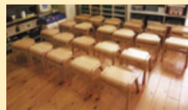
新・おぎょうぎチェア