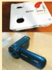
プロジェクター・ビデオカメラ