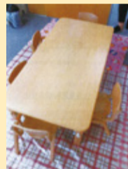
木製折りたたみテーブル・椅子