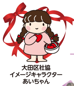
大田区社協 イメージキャラクター あいちゃん