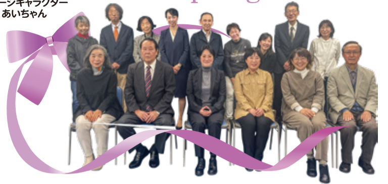
市民後見人交流会に参加の皆さま 2024/11/12

編集・発行 社会福祉法人 大田区社会福祉協議会 〒144-0051 東京都大田区西蒲田7-49-2 ☎ 03-3736-2021 FAX 03-3736-2030 🌐 https://www.ota-shakyo.jp 📄 https://x.com/ota_shakyo