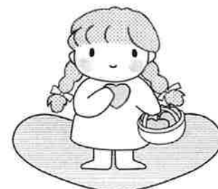
大田社協イメージキャラクター あいちゃん