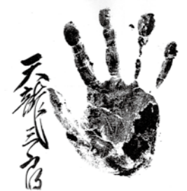
「角界三筆」と評された達筆

晩年、青少年の武道精神育成のため『(財)鹿島神武殿』を設立し、初代理事長に就任しました。そして二年後、総工費5億円、柔道場、剣道場、相撲場などからなる日本初の総合道場を完成させたのです。私財も投じた、一生一代の社会的事業を成し遂げたのです。「角界三筆」と評された達筆