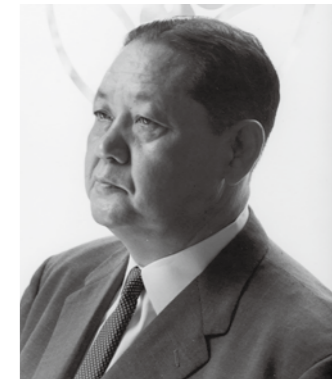
相撲放送の解説者時代

が誕生。満17歳6か月でした。部屋は100名を超える大所帯ですが、土俵は一つ、朝暗いうちに起きて稽古に励みました。好成绩を上げ、翌年1月に東序の口11枚目に昇進した時、四股名を「天龍」に改めたのです。昭和3年に十両優勝を果たし、念願の入幕は初土俵以来足掛け9年、16場所目、26歳の春でした(当時は年2場所でした)。インテリであり、色白で美貌の天龍は人気力士だったのです。