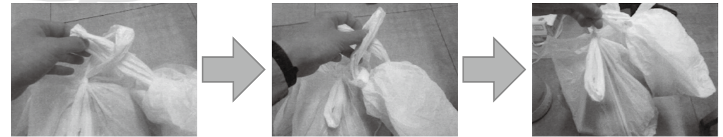
①片方の袋(左側)の持ち手の輪っかに、もう片方の袋(右側)の持ち手を通します。

現場の清掃職員がお教えるちょっとひと工夫 ~今日から試せる! 小さなごみ袋の合体方法~