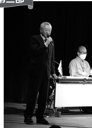
中央一丁目町会 岩井会長