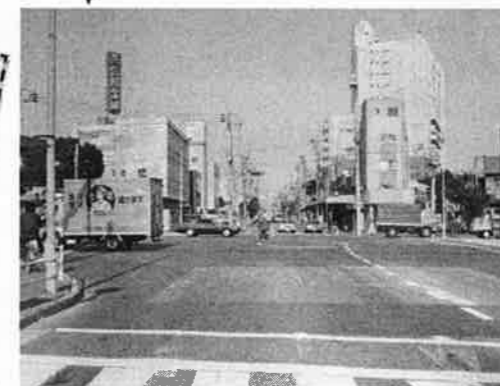
④ 池上通り上から春日橋交差点を大森方向に見る(昭和59年)。左に「芝信用金庫」の看板。春日橋交番は、昔は環七をはさんで大森側にあった。陸橋がないと広々として見える。