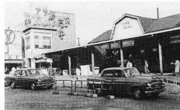
① 大森駅山王側(昭和36年)。昭和57年7月、駅舎改築工事着工し、59年7月現駅舎完成。通路ができて、東側と山王側がつながった。