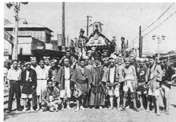
⑧ 池上通り(昭和23年)。現在のカドヤの前あたり。左手前は映画館入口か?右奥に白木屋。