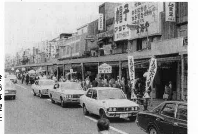
② 池上通り(昭和51年)。山王三丁目バス停あたり。今ある店あり。なつかしい店も。