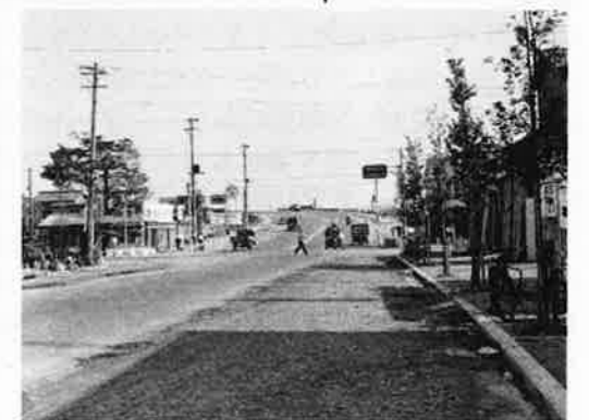
⑤ 環七上から春日橋交差点を平和島方面に見る(昭和31年)。昭和61年に池上通りと立体交差になった。奥の道路が上がっているところの下は国鉄(現JR)の線路。