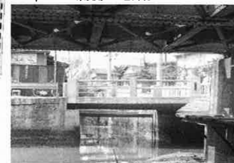
⑦ 新田橋から内川上流を見る(昭和43年)。鉄橋向こうで正面の支流と右からの本流が合流。今は上流側は暗渠。