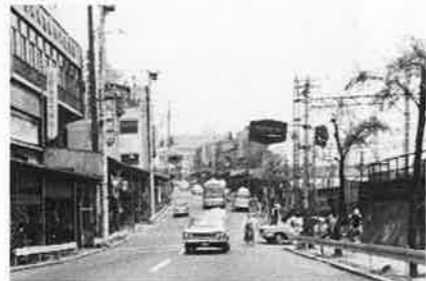
▲池上通り・八景坂(S42), 右手に柳の木

地元の方ならご存知の方も多いと思いますが、この通りは柳本通りとも呼ばれ、昭和40年代中ごろまでは見事な柳が立ち並んでいました。