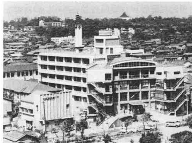
⑩ 旧大森赤十字病院。向かい側に旧新井宿特別出張所がないので、昭和41年よりも前と思われる。遠くに本門寺の五重塔が見える。