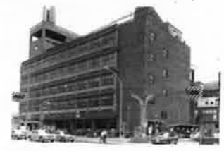
昭和47年撮影 増築・改修途中の写真