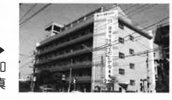
平成4年撮影▶ 大規模改修完了(昭和63年6月)後の写真