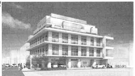
▲ (仮称) 障がい者総合サポートセンターイメージ図

大田区は、平成26年度開設予定で、大森赤十字病院の旧日本館跡地に障がいのある人の生活をサポートする施設として、「(仮称)障がい者総合サポートセンター」の建設を進めています。建物は地上5階建てで、ボランティア活動室、障がい者就労支援センター、多目的室、備蓄倉庫などを備え、「相談」「地域交流」「就労」「居住」の4部門で総合的にサポートしていきます。