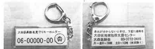
▲大田区高齢者見守りキーホルダー (表・裏)

★ 登録事項は？ ☞ 住所、氏名、性別、生年月日、介護認定の有無、電話番号、緊急連絡先(2名)、かかりつけの医療機関、主治医、病歴、内服薬名、アレルギー、担当ケアマネジャー・事業所名などです。