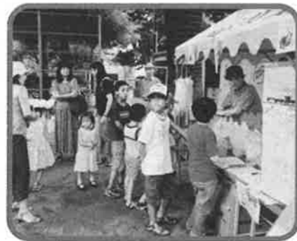
おみやげはなあ〜に？

お祭りには大森消防署から本物の消防車、区からは地震を体験できる起震車がやってくる。また、公園に備蓄されている期限切れ間近の非常食を女性隊員が、おいしいカレーに防災クッキングと称しリサイクル。そのほか金魚すくい、輪投げ、パケツリレー、餅つき、焼き鳥など親子で楽しめるアトラクションが盛りだくさん。防災協力隊の日ごろの訓練の成果を披露するポンプ車による迫力ある放水実演も。また、今回は新企画、隊員による「山王サンバ」のバンド演奏。公園中がひとつになってサンバを踊った。さあ、次回は山王公園の子供祭りをのぞいてみませんか。