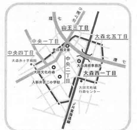
新井宿五丁目町会区域図