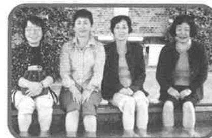
三保園ホテルで足湯

我が町会は、昭和15年4月に発足とのこと。70年近くの歳月を19代にわたる歴代の町会長を中心に、各時代に即応した役割を担ってまいりました。現在の主な年間行事の一つに、バス2台分の参加者がある人気の日帰りバス旅行があります。昨秋は、静岡まで遠出し、三保園ホテルで、駿河の美味と温泉情緒を堪能、更に、みかん狩りを楽しみました。その他、鎌倉期に創建といわれる春日神社の祭礼、大田文化の森のカラオケ・盆踊り大会への参加、参加賞も愉しみな夜間の防災訓練など数多くの活動を行っております。