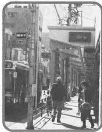
新柳会商店街 振興組合員一同