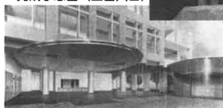
▼完成予想図 (正面入口)