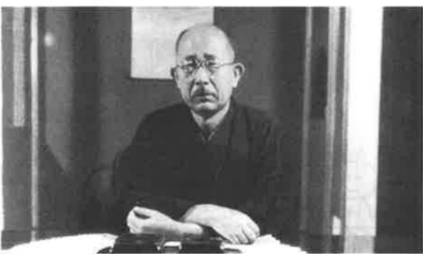
昭和二十一年ごろの有二三

発行 わがまち大田新井宿地区推進委員会 編集 「わがまち新井宿」編集委員会 監修 新井宿地区自治会連合会 事務局 大田区新井宿特別出張所 大田区中央四一三二一四 三七七六一五三九