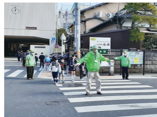
みまも 見守り 要支援者の見守り活動 登下校時の学童見守り活動、パトロール