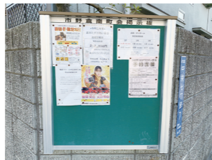
じょうほう はっしん 掲示板を使った情報発信