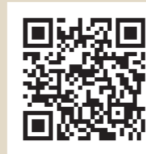
はねびよん健康ポイントについてはこちら

池上競馬場は、競馬場としては日本人の手による初めての馬券が発売され、当時は大盛況であったようですが、馬券の発売が禁止されると、収入不足からわずか5年で廃止されてしまいました。