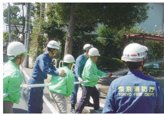
ぼうさい 市民消防隊訓練 学校防災活動拠点防災訓練