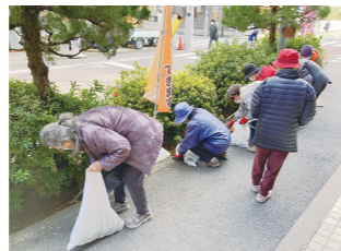
せいそう 路上清掃活動