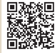
自治会・町会へ加入を希望する方はこちら

当時の呑川は灌漑用水や飲料水として利用されており、やがては「大森海苔」の育成に必要な栄養分を運ぶ河川として、特に下流では海苔船の交通路としても重要な役割を果たしていたようです。