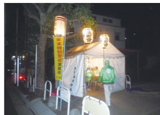
ぼうはん 防犯パトロール 年末の夜警活動 掲示板での防犯情報周知 青色パトロール車で巡回 防犯灯などの設置・運営