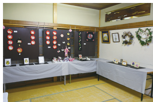
イベント 夏祭り、盆踊り 文化展など