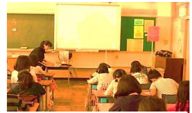
電子黒板を見て書き写します

1学期に行われた交流活動の様子です。4月に改訂された、幼稚園教育要領等の中に「円滑な接続のためには、幼児と児童の交流の機会を設け、連携を図ることが大切である」と明記されています。各園と小学校間が交流をきっかけにして連絡を取り合う中で、計画的に行っていくことが望まれます。