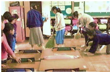
6年生と一緒に掃除

園生活で経験した給食当番などの活動は、小学校では当番や係活動、そして朝の会の進行など、様々な役割への取り組みとなり、その仕事の内容や進め方を班やグループで話し合いをしてすすめていました。栽培、飼育等では、観察カードに日々の成長を絵と文で記録する表現からは、幼児期の経験や豊かな感性との繋がりが感じとれます。