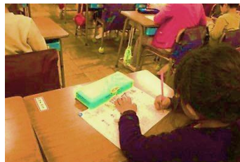
正しい鉛筆の持ち方