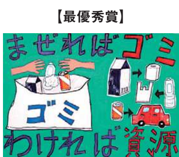
西六郷小4年 北原 綾乃