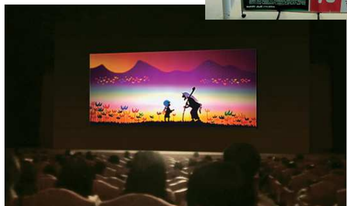
写真は前回(2015年)の事業の様子から