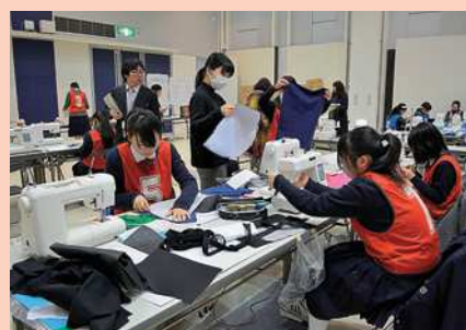
昨年度の様子から

問合せ先 指導課指導主事 TEL 5744-1435 FAX 5744-1665