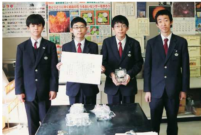
蒲田中学校 プラネット科学部の皆さん

読売新聞社主催の「第60回日本学生科学賞」東京都大会において、蒲田中学校プラネット科学部が中学の部優秀賞を受賞しました。受賞の研究テーマは「なぜ火星の表面には鉄分が多いのか」でした。