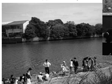
防潮堤の仕組をフィールドワークで確認しました。

「自分が住んでいた大槌町について調べてくれて嬉しい。世界の人口の6割は海沿いに住んでいます。海は怖いですが大切なものです。被災地は自衛隊の人や国内外からの援助によって助けられました。防災は、一人一人の意識を高めていくことが大切です。」