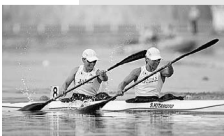
【カヤック種目】座った姿勢でパドルの両端で左右交互に水をかきながら艇を進めます