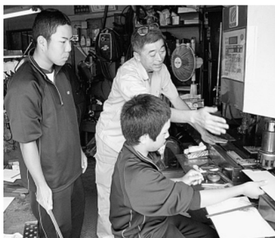
諸岡鋳金 S.S で

社会人・職業人として自立できる子どもの育成を、地域ぐるみで推進していく事業です。地域の商店や事業所のご協力をいただき、平成23年度は、すべての区立中学校において3日間以上の職場体験学習を実施しています。