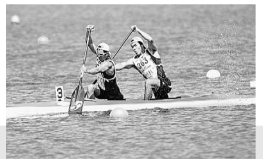
【カナディアン種目】立膝の姿勢で、艇の片側をパドルでかきながら艇を進めます。