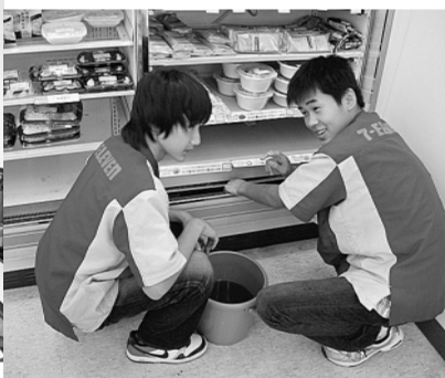
セブンイレブン西蒲田8丁目店で