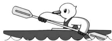
「ゆりーと」 スポーツ祭東京2013の マスコットキャラクターです

平成25(2013)年、東京で第68回国民体育大会が開催されます。大田区では正式競技としてカヌー(スプリント)競技が行われます。それに先立ち、今年は7月15日(日)に、リハーサル大会(関東ブロック大会)が開催されます。スピード感にあふれ、見応えのある競技をお楽しみください。