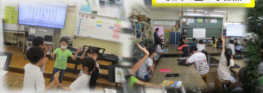
1年生から専科授業(音楽・図工)