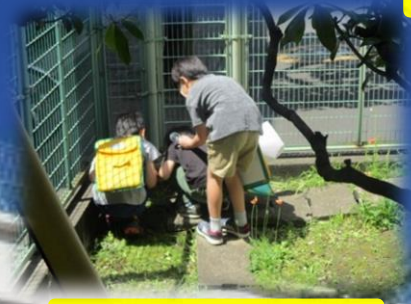
校内の豊かな自然