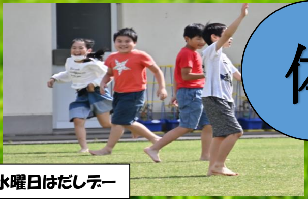
水曜日はだしデー