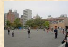
学校地域支援本部 (朝遊び)