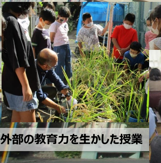
外部の教育力を生かした授業