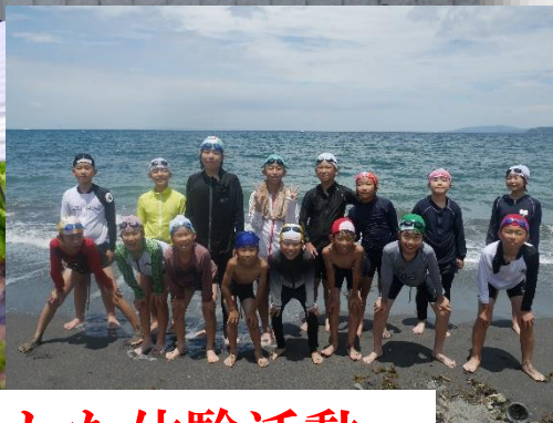
自然を活かした体験活動