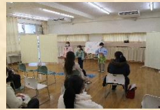
日本語学級学習発表会