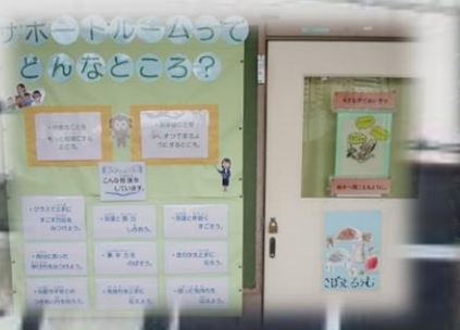
サポートルーム拠点校