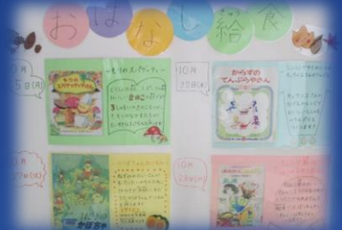
おいしい給食 献立の工夫