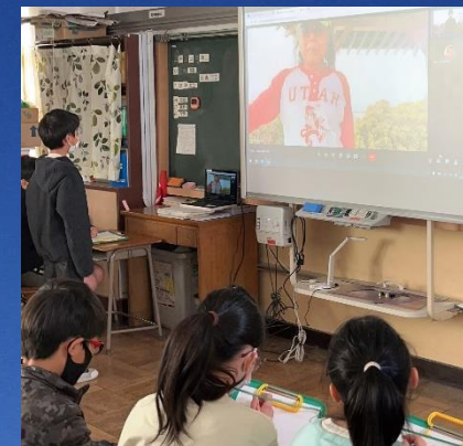
母島とのオンライン交流