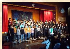
学習発表会では認め合いを