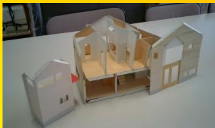
ものづくりの試作品

令和7年度、新たな「知」と想像する児童の育成をめざした、「おおたの未来づくり」カリキュラム」の開発に取り組んでいます。