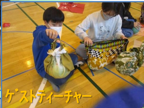
ゲストティーチャー