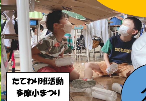
たてわり班活動 多摩小まつり