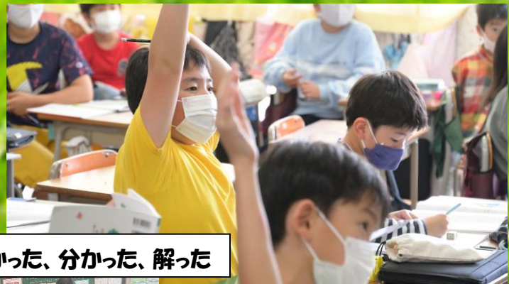
わかった、分かった、解った