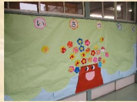
取り組んだ「あいさつの花」