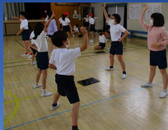
運動会 伝統のソーラン節の引き継ぎ