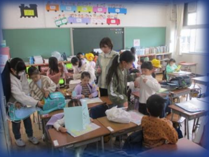
小規模校のよさ 仲良し