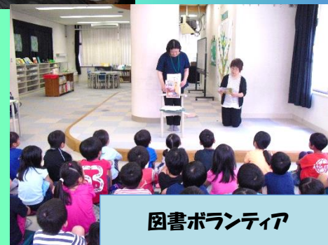
図書ボランティア