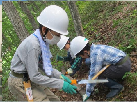
とうぶ移動教室 間伐伐採自然体験