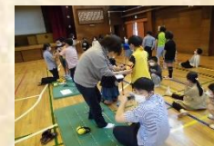
特別養護老人ホーム 職員との交流