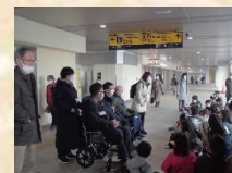
京急蒲田駅 利用者との交流