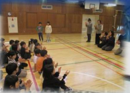
高齢者とのふれあい