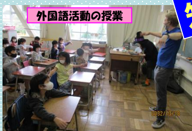
外国語活動の授業