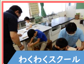
わくわくスクール