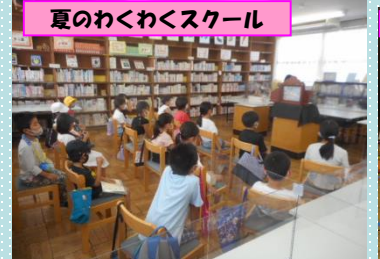
夏のわくわくスクール