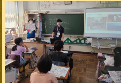
大田観光協会とのコラボ学習 地域を活性化させる企画づくり