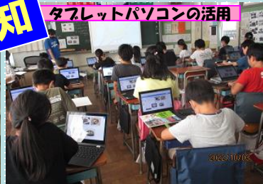
タブレットパソコンの活用