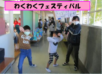
わくわくフェスティバル