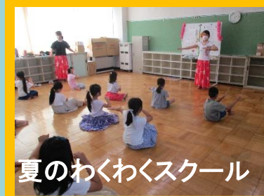
夏のわくわくスクール