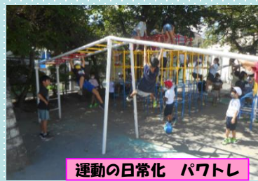
運動の日常化 パトロール