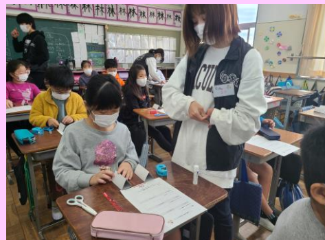
東京大学CASTとの科学的な思考を高める学習