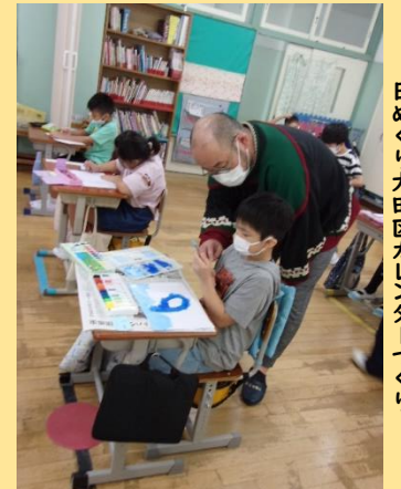
グリーンエレファントとのコラボ学習 日めくり大田区カレンダーづくり