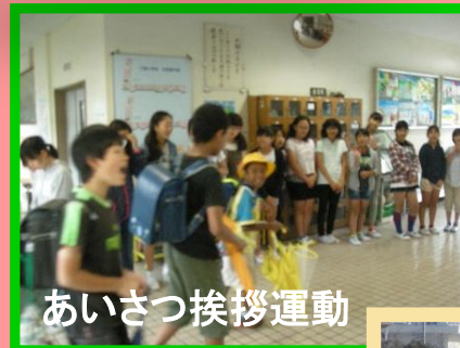
あいさつ挨拶運動