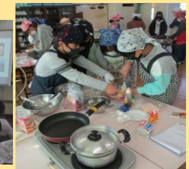
守半海苔店とのコラボ学習 海苔を使ったレンピ開発