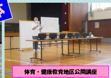
体育・健康教育地区公開講座