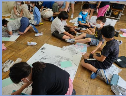
主体的・協働的な学び