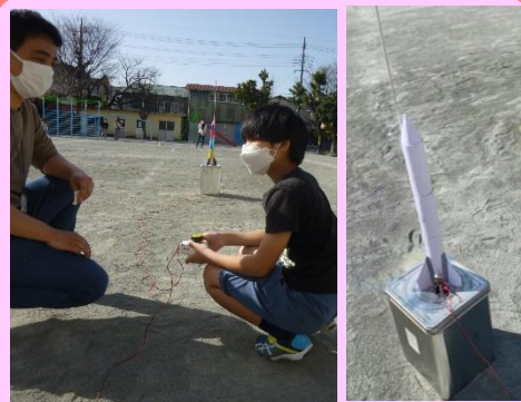
飛行機ロケットプロジェクト