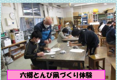
六郷とんびんぷり体験