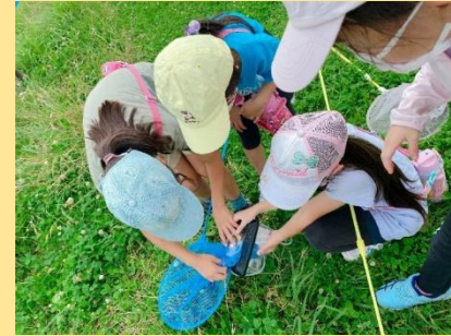
生活科：めざせ いきものはかせ！ 多摩川とびはぜ倶楽部とのコラボ学習