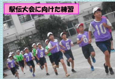
駅伝大会に向けた練習