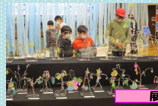
展覧会 なかよしギャラリートーク