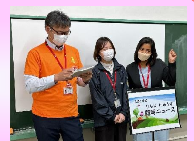
企業（亀田製菓）との商品開発学習