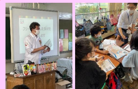
永谷園とのローリングストック食の献立づくり