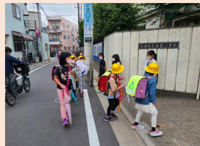
児童が主体的に取り組む活動 あいさつ運動