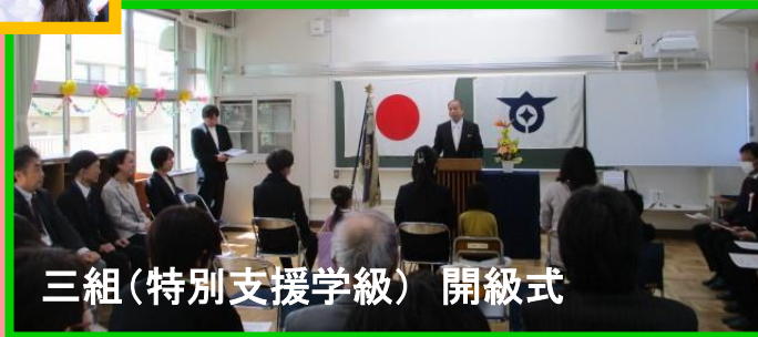
三組(特別支援学級) 開級式