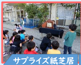
サプライズ紙芝居