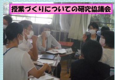
授業づくりについての研究協議会