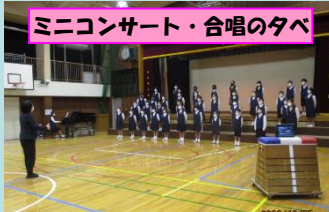
ミニコンサート・合唱の夕べ