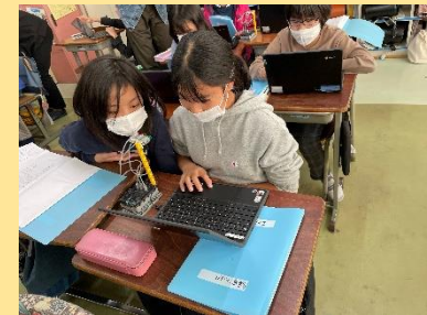
日本工学院コラボ学習 地域に合った信号機のプログラミング