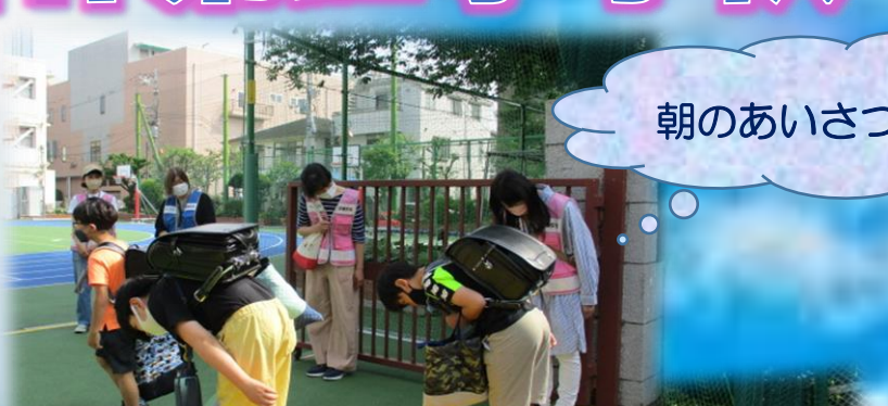
保護者や地域の方々との触れ合い