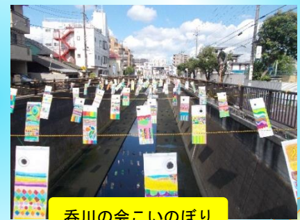
呑川の会こいのぼり