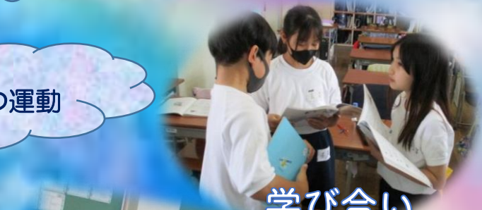
学び合い 高め合う