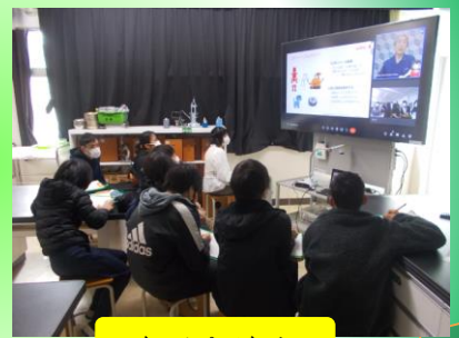
ドリームプロジェクト