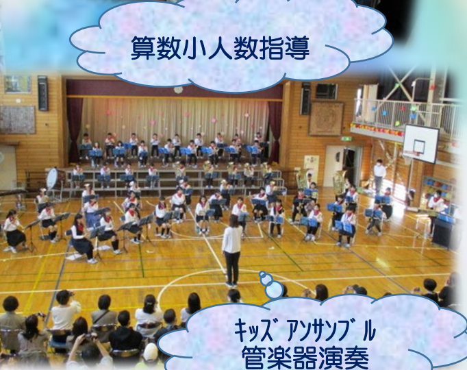
キッズアンサンブル 管楽器演奏