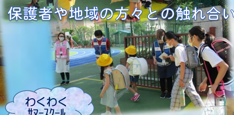
わくわく マ-スクル