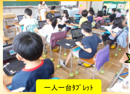
一人一台タブレット