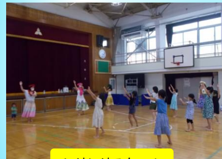
いけいけスクール