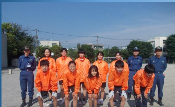
東蒲レスキューチーム