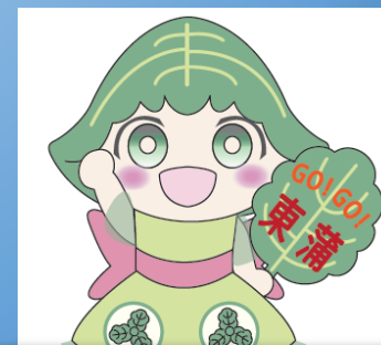
東蒲中公認キャラクター とうほもちちゃん