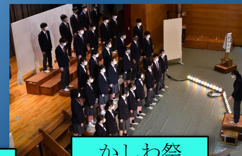
かしわ祭 合唱コンクール