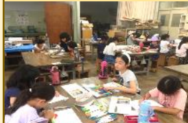
絵を描いて 公園を飾ろう

子どもたちの体験の機会を増やすための講座を開催しています。 2年度開催(今年の漢字のみ3年度)