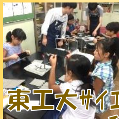
東工大サイエンステック/ 科学講座