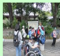
引率ボランティア