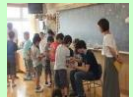
通訳ボランティア