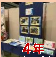
4年 ものづくり教育・学習フォーラム発表