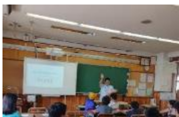
たのしく学ぼう お金のイロイロ

令和元年度は、ものづくり、スポーツ体験、理科実験、いけばな・茶道など全 41 講座、のべ 648 名の児童が参加しました。