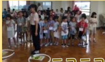
ニコニコ ロータリー 夏祭り