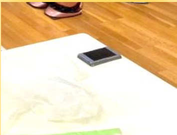
日本工業大学ロボット講座