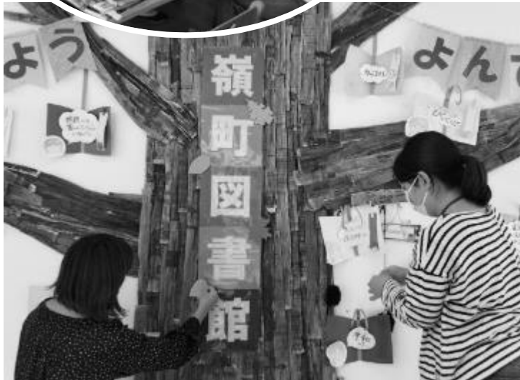
“季節のテーマ” にそった展示づくり