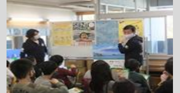
大田区の銭湯の話