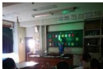
見てさわってわくわく理科実験 カラーアナライザー