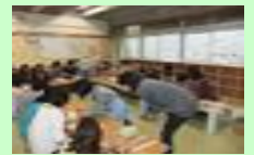
図書館ボランティア