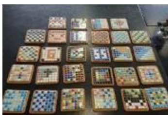
タイルクラフト わくわくコースター作り