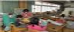
子ども 1 日図書館員