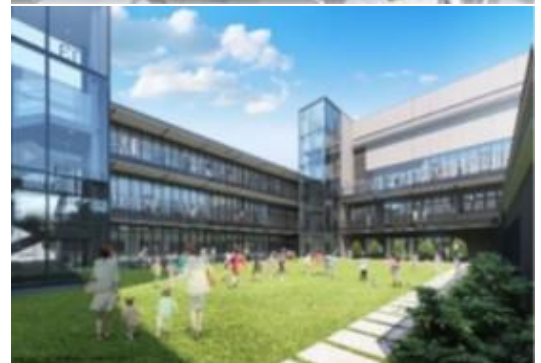
【整備イメージ】(Ⅱ期整備後)