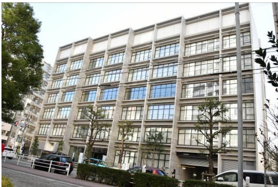
【スマイル大森(大森北四丁目複合施設)】