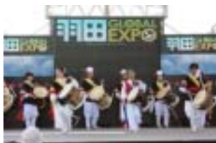
羽田空港国際化記念事業

平成 22 年 10 月 21 日、羽田空港第 4 滑走路が供用開始となり、10 月