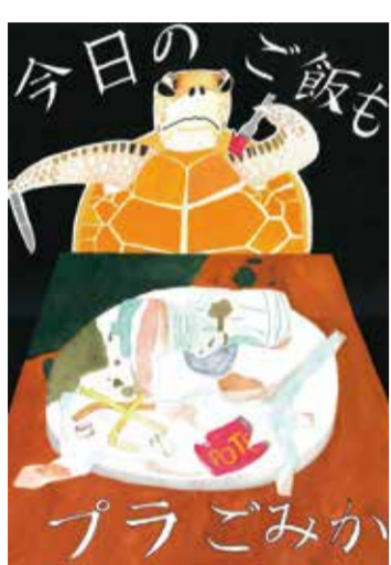
令和3年度 中学生の部最優秀賞

夏休みの課題として環境について考え、ポスターで表現してみませんか。詳細は区のホームページをご覧ください。