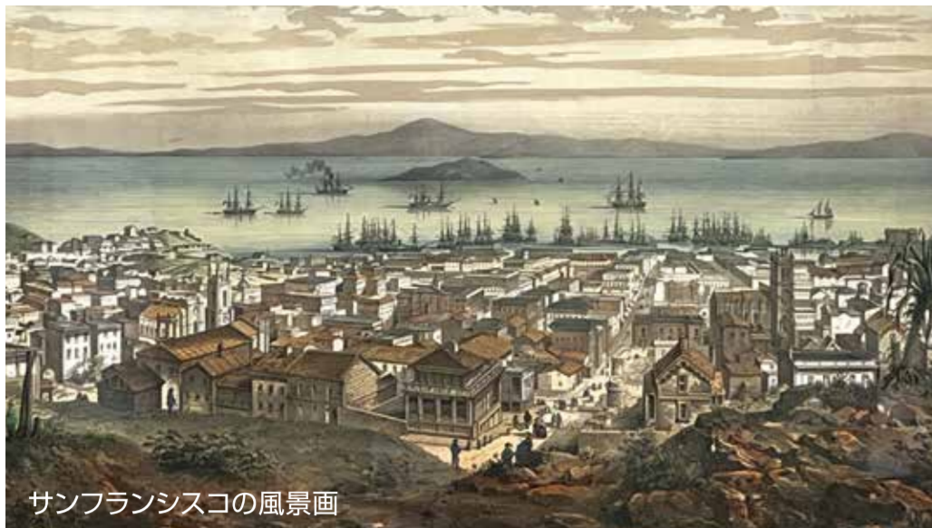
サンフランシスコの風景画