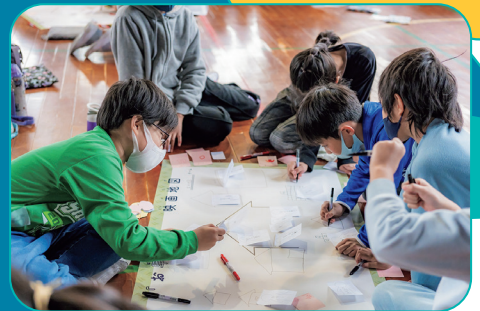
過去のワークショップの様子