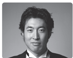
関口 直仁 (バリトン)