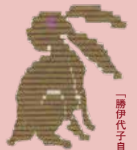
「勝伊代子自製絹刺標本」より