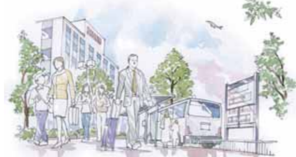
空港・臨海部への交通利便性の高い大森駅東口は、居住者・通勤者・観光客など多くの人が訪れています。