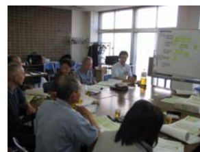
まちづくりを考える場