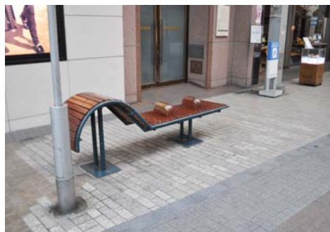
高松市丸亀商店街