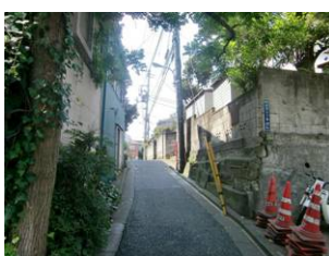
起伏に富んだ山王の地形