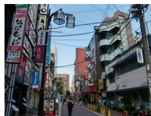
駅東側の市街地景観