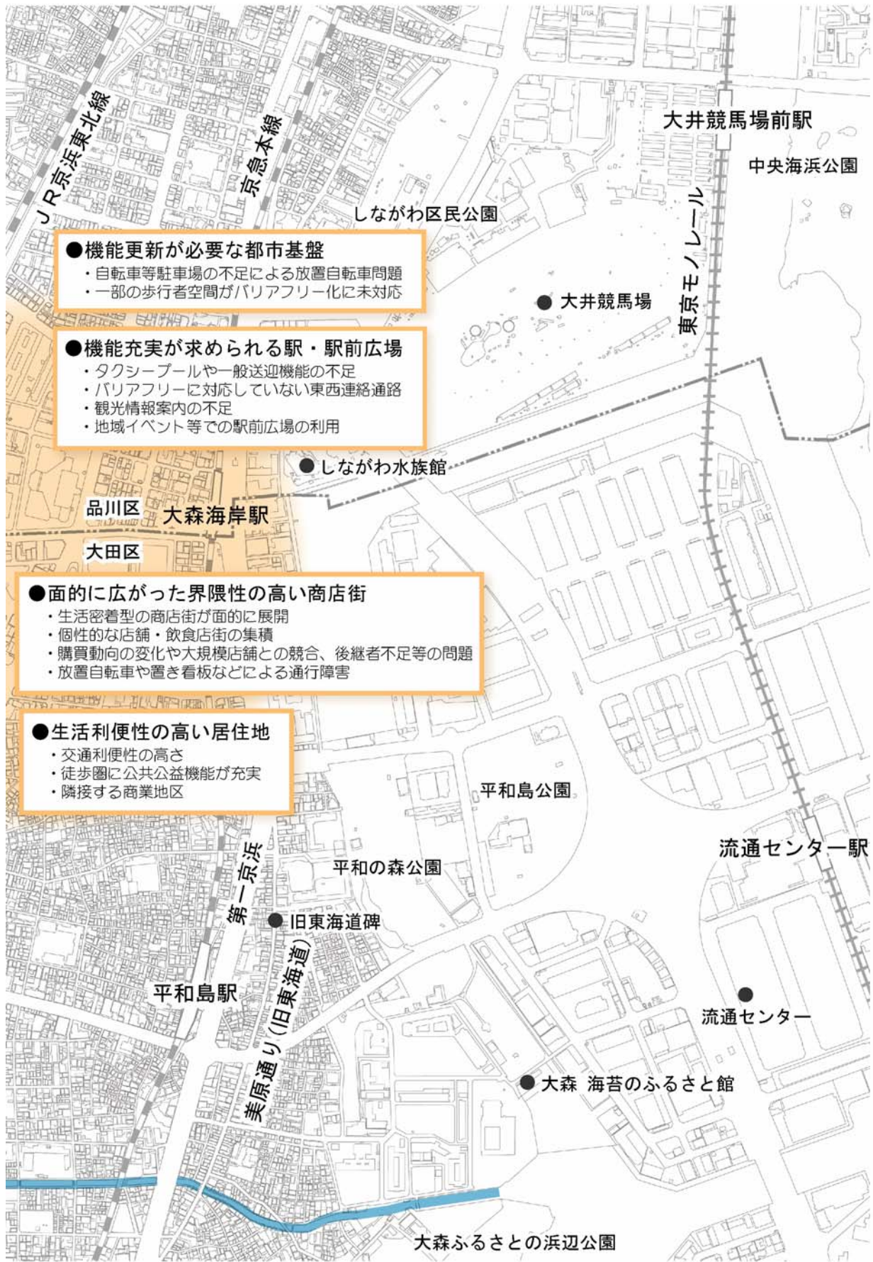
大森駅周辺地区の現況図