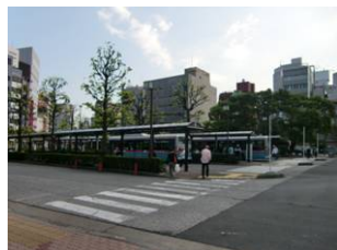
駅東口バスターミナル