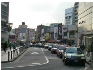
路上に並ぶタクシー