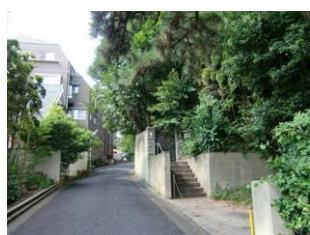
緑豊かな山王の住宅地