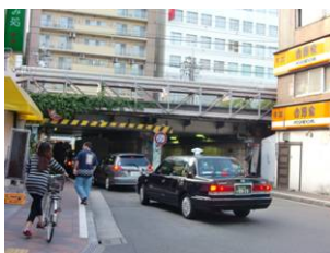
駅南ガード下(新井道)