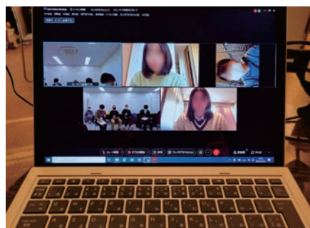
子どもたちはオンラインにて率直な意見を発表