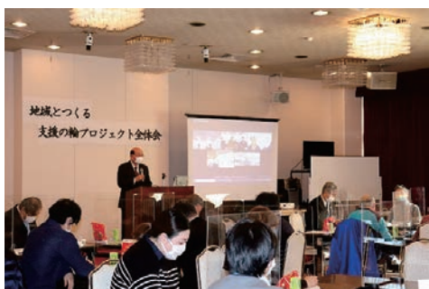
地域で子どもを支援する多様な団体が参加