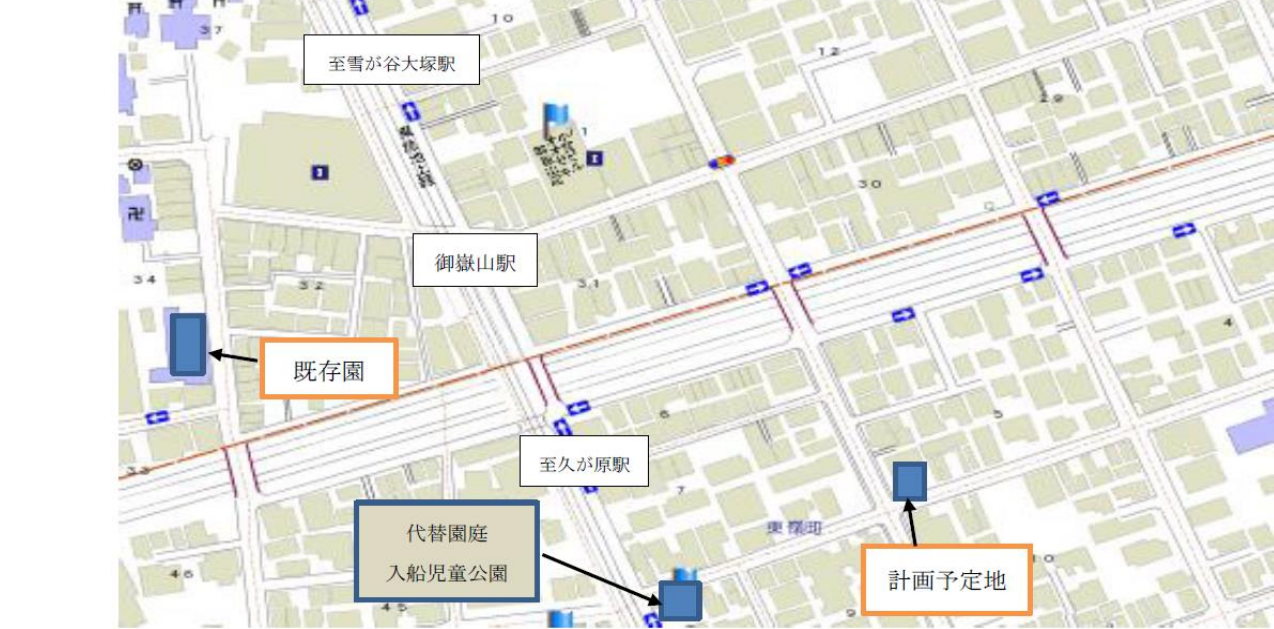
東急池上線 御嶽山駅徒歩3分