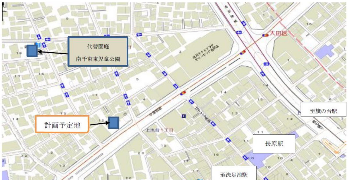
《地図》 東急池上線 長原駅徒歩4分