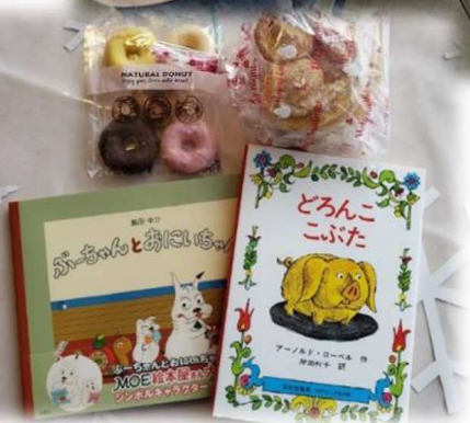
絵本でつなぐ地域と親子のきずな