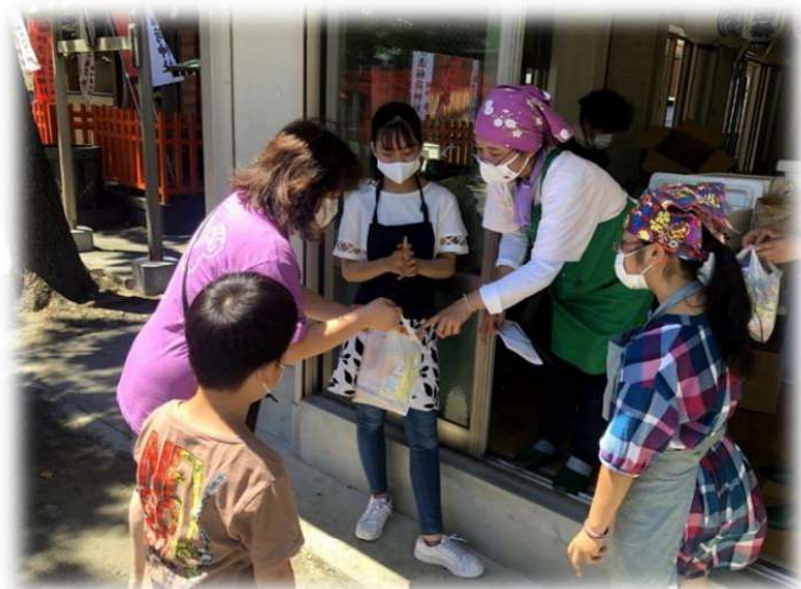
おおたラーメンこども食堂 (本羽田)