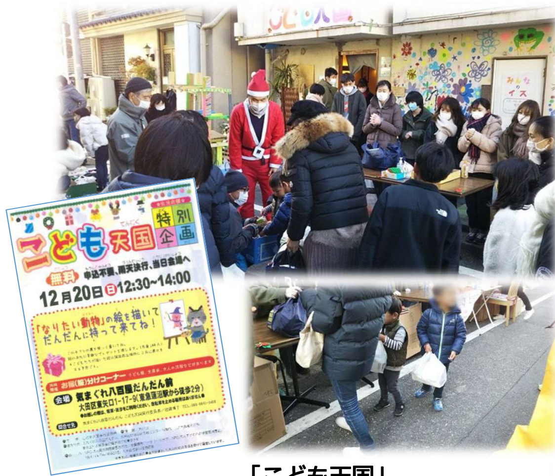
「こども天国」 だんだん こども食堂 (東矢口)