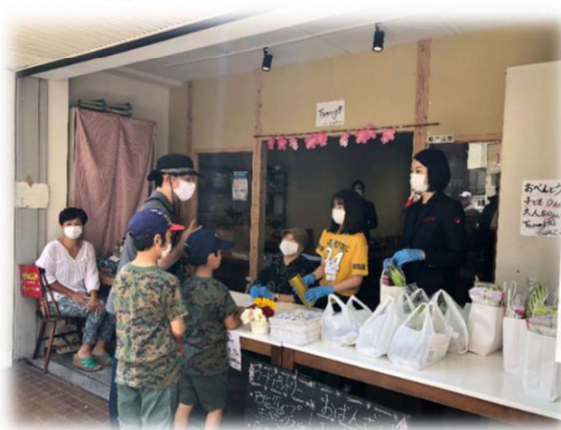
Tsumugi こども食堂 おぼんざい地獄に佛 (山王)