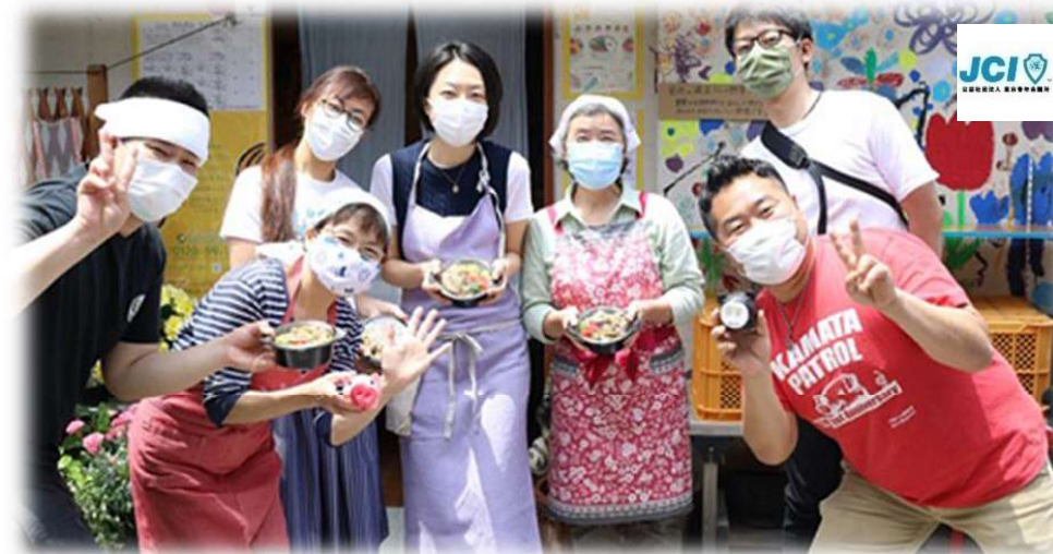
東京青年会議所大田区委員会・区内飲食店 だんだん こども食堂・区内こども食堂6か所 学習支援団体