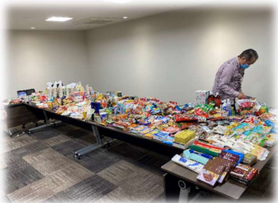
大田区社会福祉協議会 (蒲田)