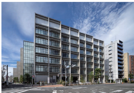
大森北四丁目複合施設（スマイル大森）

質の高い区民サービスの提供を維持し、自然災害や新たな感染症の蔓延などの予期せぬ財政需要への機動的な対応や、未来への投資を着実に推進するためには、財政の持続可能性を確保することが不可欠です。そのため、絶えず施策の新陳代謝に取り組み、経常収支比率*の適正水準を維持するとともに、計画的な基金*残高の確保や特別区債*の戦略的な活用など、財政対応力の堅持に向けた努力と工夫を行い、将来にわたり強靱な財政基盤を構築します。