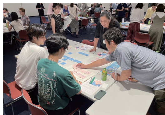
基本計画・実施計画策定に向けた区民ワークショップ

満足度の高い区民サービスを提供するためには、区民の声を区政に反映するとともに、大田区に関わる多様な主体それぞれが持つ特性や強みを活かすことが重要です。そのため、区民活動団体や民間企業等との連携・協働を更に推進し、複雑化・多様化する地域課題の解決と地域の活性化を実現します。