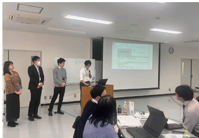
新任主任研修（政策形成基礎）

また、区民サービスの向上に加え、業務の効率化に資する「自治体DX*」やアウトソーシング*手法を活用するとともに、「効果（アウトカム）」を重視した事業の検証・評価等により効果を最大化し、既存事業の統廃合を含めた事業の見直し・再構築を進めます。