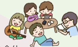
施策の内容を表すイラストを挿入