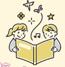
施策の内容を表すイラストを挿入