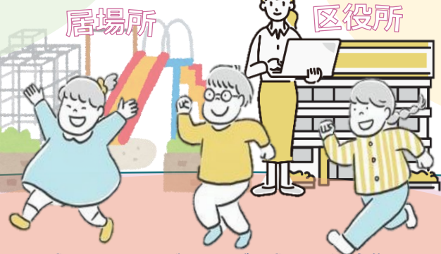
居場所 区役所 地域の中でウェルビーイングを感じながら自分らしく成長しているこどもたちのイラストを挿入