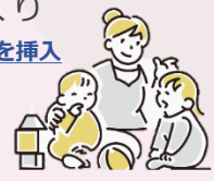
施策の内容を表すイラストを挿入