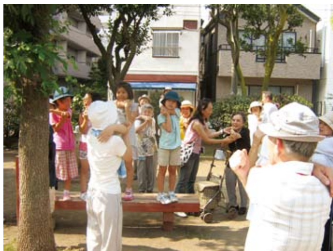
公園体操のイメージ