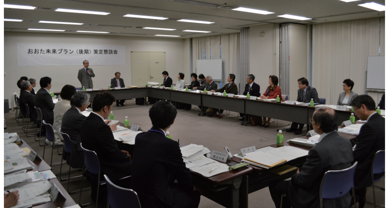
策定懇談会の様子(平成25年4月25日)

平成25年4月には、未来プランの検証も含め、大田区基本構想審議会の委員を中心に、新しい区民公募委員を2名選定の上、「おおた未来プラン(後期)策定懇談会」を設置しました。4月、7月、11月と懇談会を3回開催する中で、様々な立場から多様なご意見をいただき、未来プラン(後期)に反映してきました。