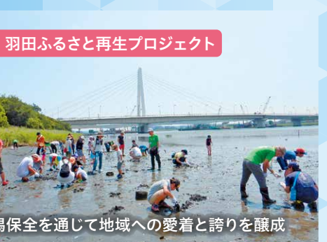
羽田ふるさと再生プロジェクト