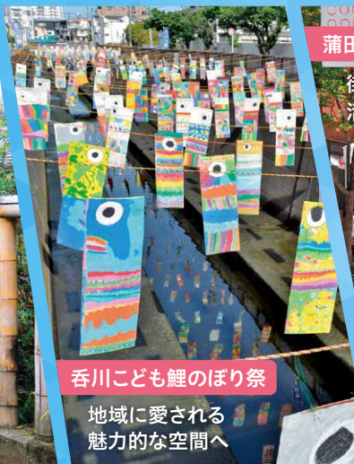
呑川子ども鯉のぼり祭