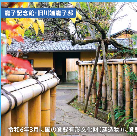
龍子記念館・旧川端龍子邸

優れた緑化計画を行い、特に周辺地域の環境と景観の向上に資するような優れた緑化が行われたもの