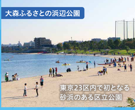
大森ふるさとの浜辺公園