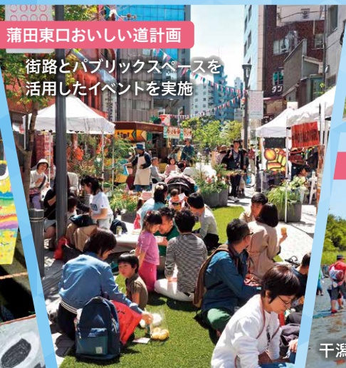
蒲田東口おいしい道計画