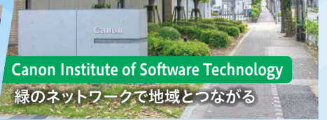
Canon Institute of Software Technology