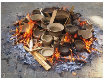
土器の焼成(野焼き)▶

「大田区立郷土博物館 友の会」「大森麦わら細工の会」「馬込文士村ガイドの会」のこれまでの歩みと活動・学習の成果を発表します。