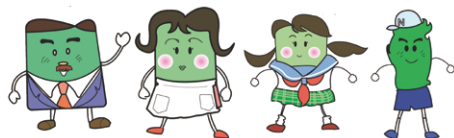
ノリノリ君ファミリー

ふるさと館のキャラクターのノリノリ君ファミリーが昭和時代に行われた海苔づくりの1年間の作業について、こどもにも分かりやすく解説します。